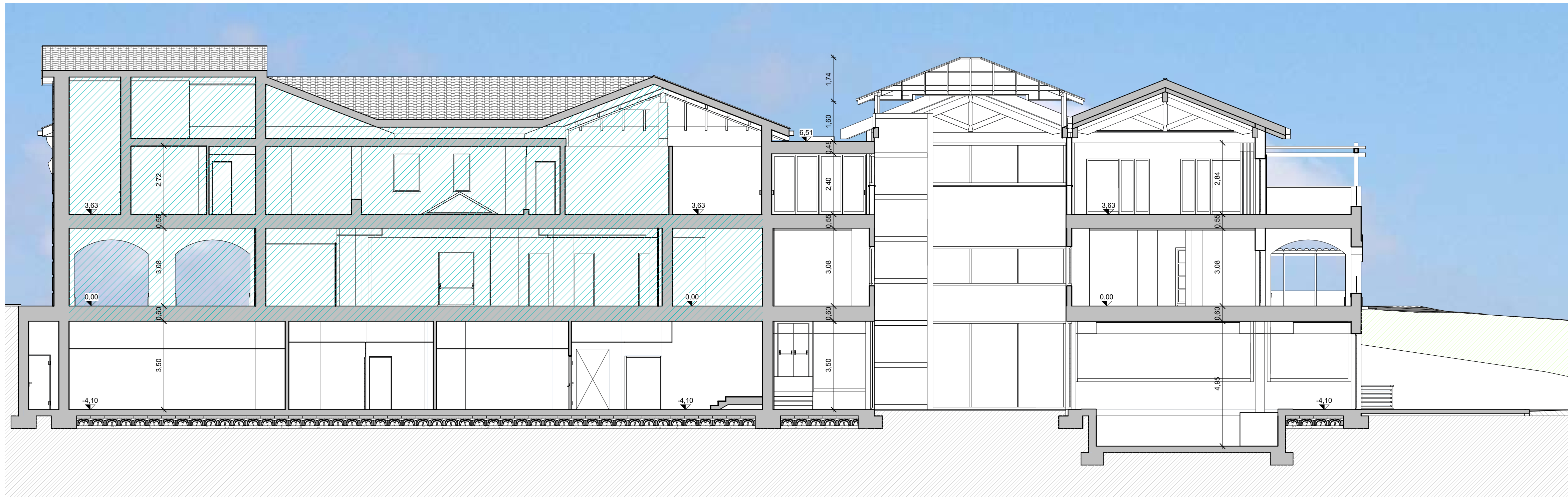
Sezione C Progetto