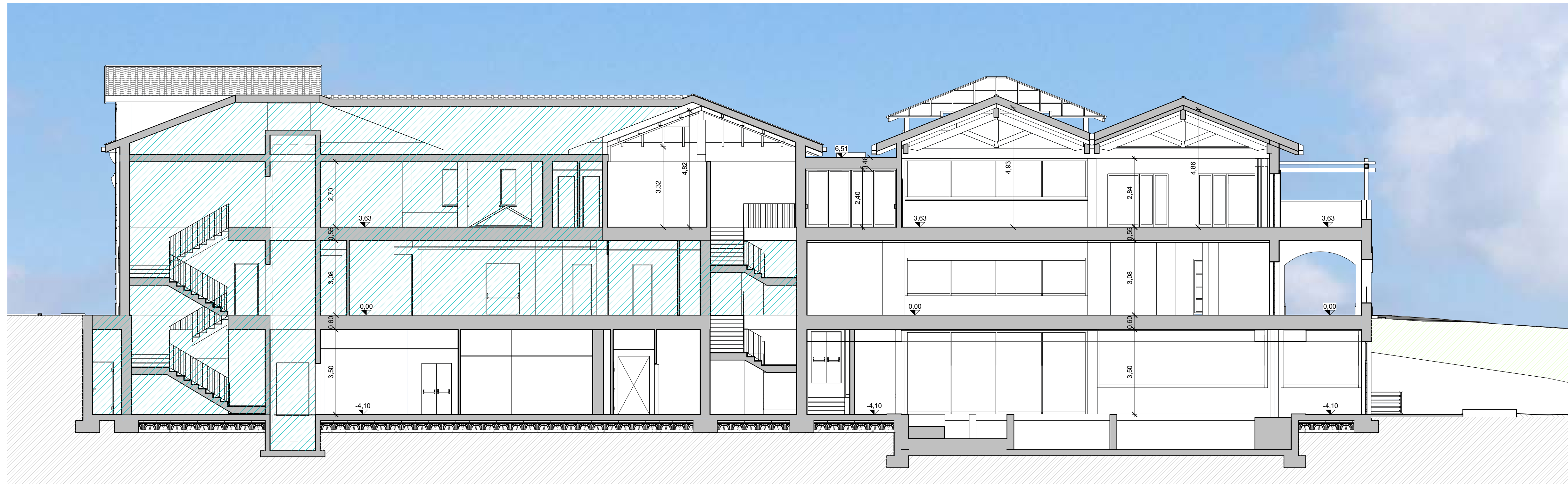
Sezione B Progetto